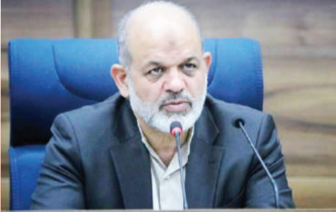
وزیر کشور: قرار گرفته که انجام این امر نیازمند مجاهدت بزرگی است. وحیدی به برخی ادعاها مبنی بر اینکه مردم از انتخابات ناامید و

منزوی شده‌اند، اشاره و تأکید کرد: ثبت‌نام حدود ۴۹ هزار نفر در مرحله پیش ثبت‌نام که از همه طیف‌های فکری هستند، نشان داد که اینگونه نیست.