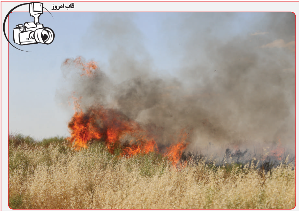
آتش زدن زمین پس از انفام کشت