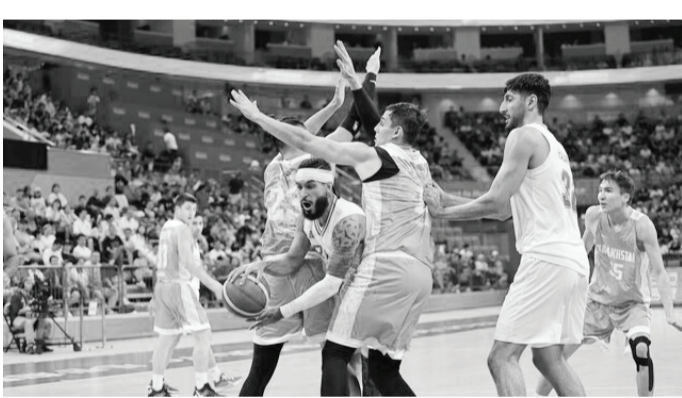
مقابل قزاقستان به پیروزی دست یابد.