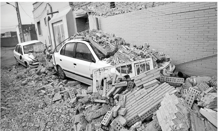
گزارش خبری - لیل‌غضنری

افزایش بیش از ۱۷ درصدی زلزله‌ها نسبت به مدت مشابه سال گذشته